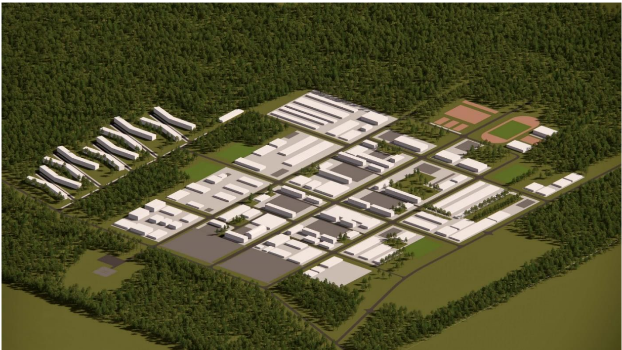
Pav.3-4 Preliminarūs Rūdinkų karinio miestelio sprendiniai

Naujai kuriamos infrastruktūros preliminarūs projektiniai sprendiniai schematiškai pateikiami paveiksle žemiau.